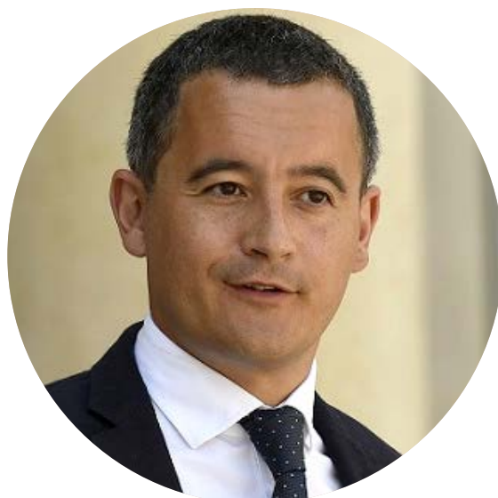
Gérald DARMANIN, Ministre de l'Intérieur