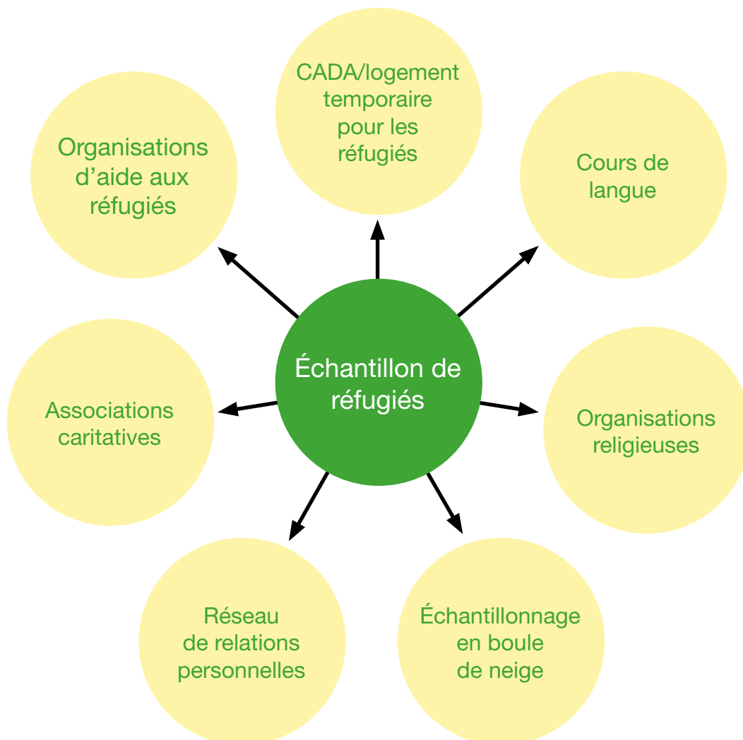
Graphique 3 : Sources d'identification des réfugiés

Sur le terrain, différentes filières ont permis d'accéder à l'échantillon :